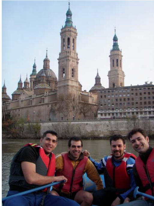
Las vistas de Zaragoza desde el río son otro de los atractivos de este tramo.

La Regata sin timonel termina a la altura del Puente de Santiago, y la parte final del descenso se dedica a hacer una puesta en común y revisión de lo acontecido en todo el descenso y en la parte final. Además se toman unas fotografías de los equipos que han corrido la regata, en las propias embarcaciones y con el Pilar de fondo.